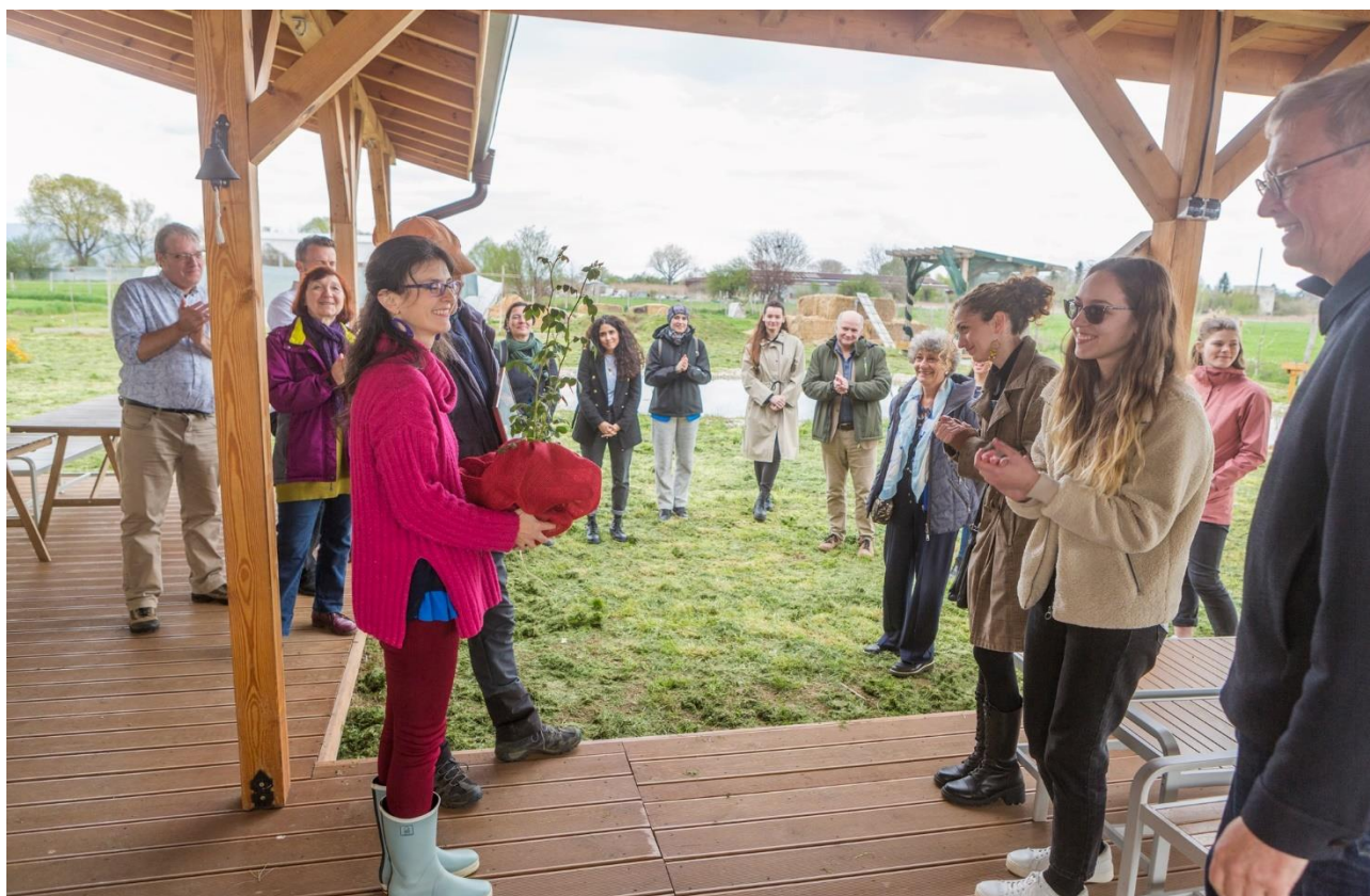
Илюстрация 3: Посещение в градска ферма в София на участниците в организираната от ИФС международна конференция по проект EFUA.