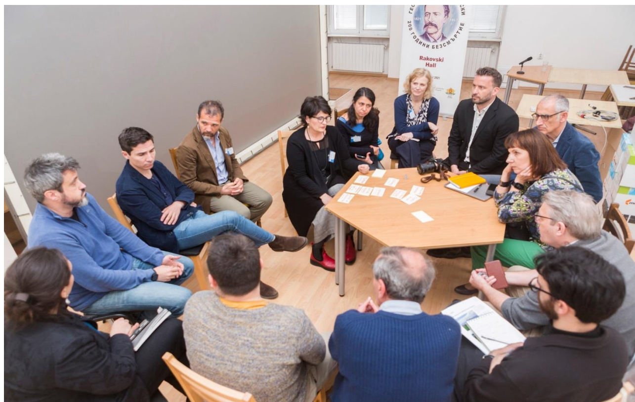
Илюстрация 4: Групова дискусия с участници в организираната от ИФС международна конференция проект EFUA.