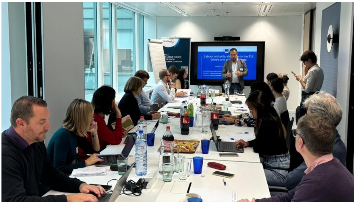
Илюстрация 4: Кръгла маса на SkiLMeeT в Брюксел, Белгия, октомври 2024