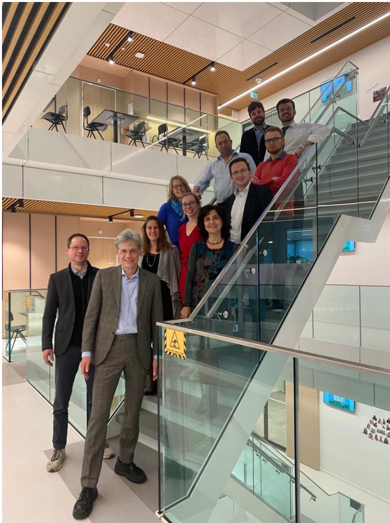
Илюстрация 3: Откриващата работна среща на SkiLMeeT в Лайден, Холандия