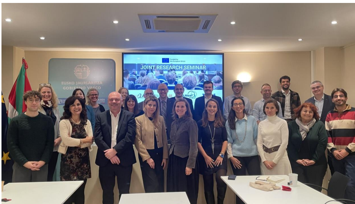
Илюстрация 5: Семинар на SkiLMeeT в Брюксел, декември 2024