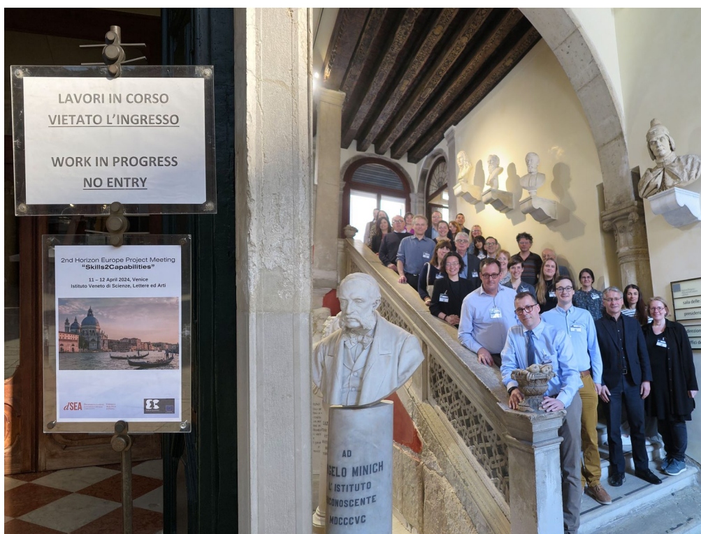
Илюстрация 1 (горе вляво): Финална конференция на проекта, организирана от Университета в Маастрихт в сградата на музея Bonnefonten, ноември 2025 г.